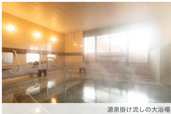
源泉掛け流しの大浴場