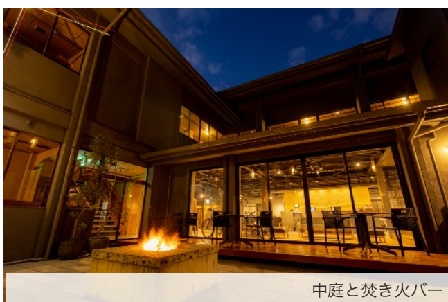
中庭と焚き火バー