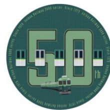
▲京阪電車開業 111 周年記念ミニチュアヘッドマーク 5000 系誕生 50 周年記念デザイン