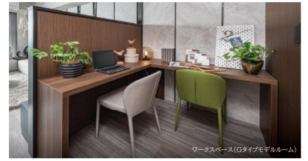
ライフスタイルに合わせて多目的に活用できる ワークスペース(メニュープラン)