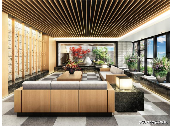
ラウンジ完成予想図