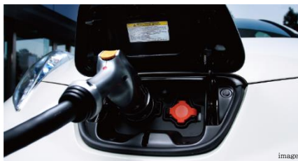
電気自動車専用の充電コンセントをご用意 電気自動車対応