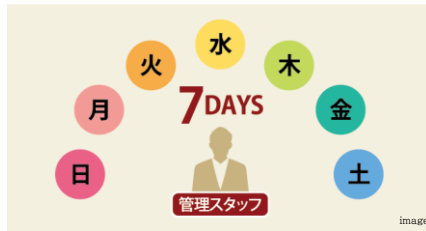
管理スタッフが暮らしや安心をサポート 7DAYS管理