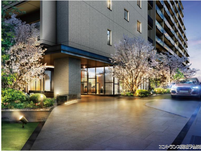
エントランス完成予想図

優美な佇まいが住まう方の誇りとなる 車寄せを設けたホテルライクな「エントランス」