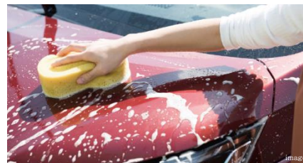
愛車の洗浄やワックス掛けなどを気軽に行える 洗車場