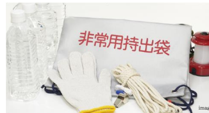
万が一の災害に備え防災備品を準備 防災備蓄倉庫