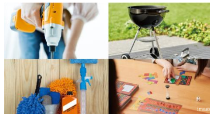
工具やアウトドア用品・パーティーグッズなどを貸し出し 備品貸し出しサービス