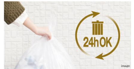
収集日や時間を気にせずにゴミ出しが可能 24時間ゴミストック