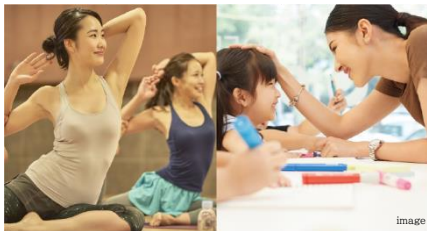
「健康」と「教育」をテーマにした教室やセミナーを開催 コミュニティサービス