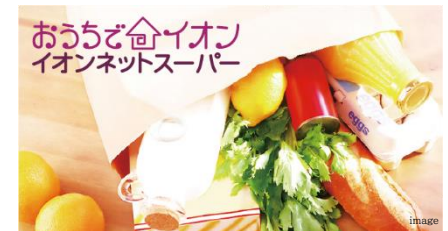
不在時はマンションに留置可能な食品配達サービス 食配ラボ(宅配ボックス型)