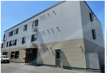
藤枝ケアセンターそよ風<外観>