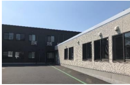
大宮三橋ケアセンターそよ風<外観>