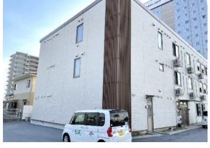
彦根ケアセンターそよ風<外観>

今後も施設の事業譲受および新規開設をはじめ、高齢者が住み慣れた地域で生活を続けられるよう、「そよ風の地域包括ケア」として様々なサービス展開に積極的に取り組んでまいります。