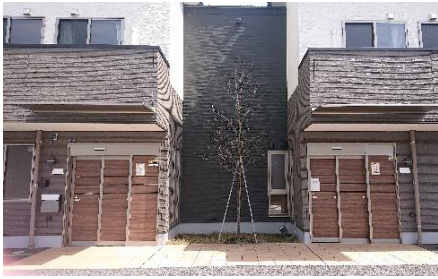
宇都宮ケアセンターそよ風<外観>