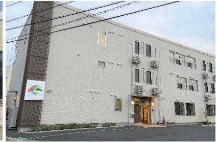
平塚ケアセンターそよ風<外観>