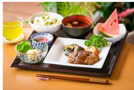
「そよ風」の食事(イメージ)

食べるということは、健康で元気に過ごすためにも欠かせないことであり、日々の生活の中でも“食事がおいしい”と思えることは、食事が楽しみになるという重要な点でもあります。おいしくて栄養バランスに優れた出来立てのあたたかい食事を提供することは、「そよ風」のこだわりでもあります。