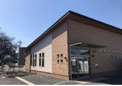
わごうケアセンターそよ風<外観>