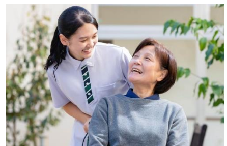
「そよ風」の介護サービスイメージ

利用者の可能性を引き出し「できなくなってしまったこと」を元気だった頃のように「再びできるようにする」ための支援をしたいと考えています。例えば、寝たきりだった方が歩けるように、オムツをしていた方がひとりでトイレに行けるようになるなど、自分らしく生活できるように、利用者自身でできることと支援が必要なことを見極めて自立を支援します。