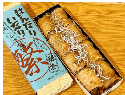
湘南しらす稲荷 1,330円 (税込)

はんなりいなりの中に堅干ししらすを入れて巻き上げました。釜揚げたしらすを三時間程天日干しし、堅さや塩分が稲荷と合い当店でも人気の商品です。