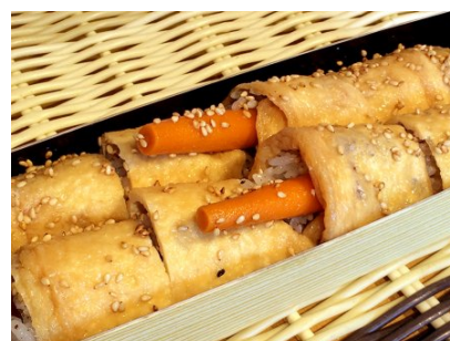
はんなりいなり山ごぼう巻き 1,230円 (税込)

はんなりいなりの中に山ごぼうの味噌漬けを入れて巻き上げました。山ごぼうの食感、しょっぱさが稲荷の甘味、食感と絶妙にマッチしてこちらも多くの方にリピートいただいている商品です。