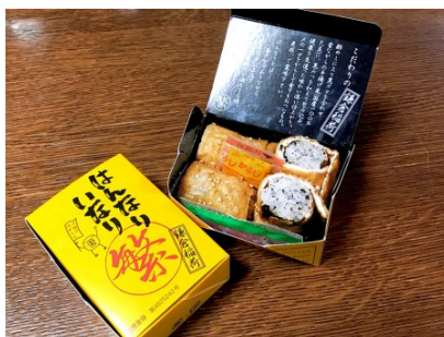
はんなりいなり(小) 450円 (税込)

広げた油揚げに黒蜜、海苔を敷きすり黒ゴマを混ぜた酢飯を巻き寿司風に巻き上げ一口サイズにカットしたジューシーな稲荷寿司で、ノーマルなはんなりいなりです。(8切入)