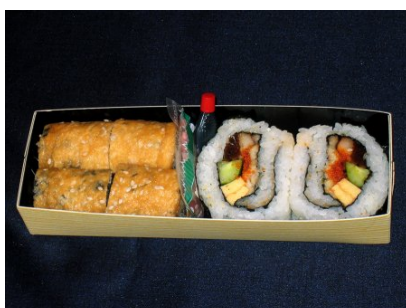
はんなりいなりと穴子太巻き 870円 (税込)

当店のメイン商品、はんなりいなり(中)を窒素真空、及び急冷凍することで自然解凍にて出来立ての味をお召し上がりいただけます。