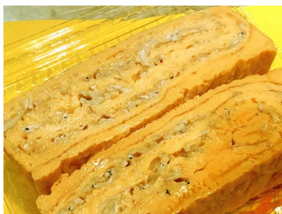
湘南しらすの玉子焼き(小) 540円 (税込)

自家製の甘めのだしを混ぜた卵で堅干ししらすを入れて焼き上げた玉子焼きです。だしの甘みとしらすの塩味が後を引く逸品です。