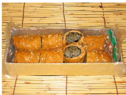
はんなりいなり(中) 900円 (税込)

広げた油揚げに黒蜜、海苔を敷きすり黒ゴマを混ぜた酢飯を巻き寿司風に巻き上げ一口サイズにカットしたジューシーな稲荷寿司で、ノーマルなはんなりいなりです。(8切入)