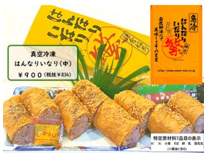
真空冷凍はんなりいなり(中) 900円 (税込)

はんなりいなりの中に堅干ししらすを入れて巻き上げました。釜揚げたしらすを三時間程天日干しし、堅さや塩分が稲荷と合い当店でも人気の商品です。