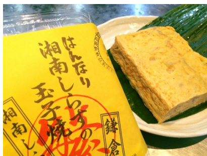
湘南しらすの玉子焼き 1,080円 (税込)

自家製の甘めのだしを混ぜた卵で堅干ししらすを入れて焼き上げた玉子焼きです。だしの甘みとしらすの塩味が後を引く逸品です。