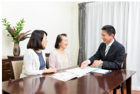
そよ風あんしんサポート(相談イメージ)

このようなことから、当社ではかねてより取り組む、高齢者が住み慣れた地域でいつまでも自分らしく生活するためのワンストップサービス「そよ風の地域包括ケア」の一環として、日常生活の中にある困りごとを解決サポートする新サービス『そよ風あんしんサポート』の提供を開始することとしました。