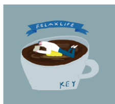
Aki ishibashi https://instagram.com/aki_ishibashi/?igshid=1orsmbka13kls