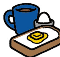
カトウ トモカ https://instagram.com/tmktmk/?igshid=9c5c7g1z0jju