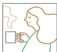
itagaki yusuke https://instagram.com/itagaki_yusuke/?igshid=1cp1ahu8x1g45