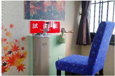
「きらら」仕様の椅子