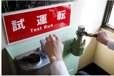
マスクン・ブレーキ