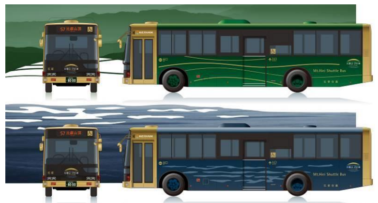
▲比叡山内シャトルバス(江若交通)