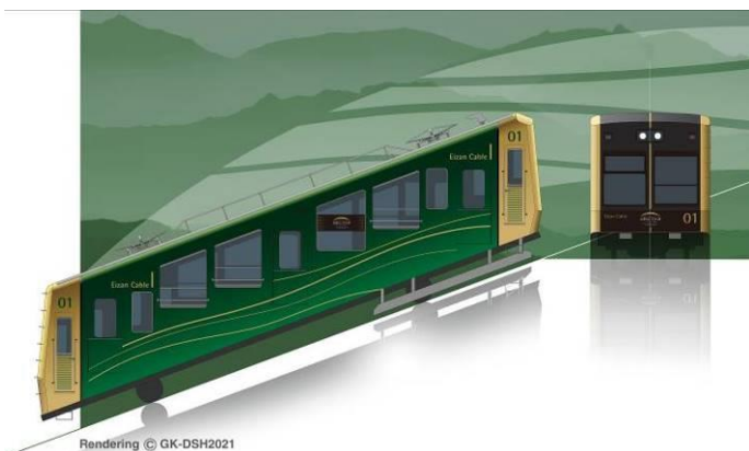
▲叡山ケーブル(京福電気鉄道)