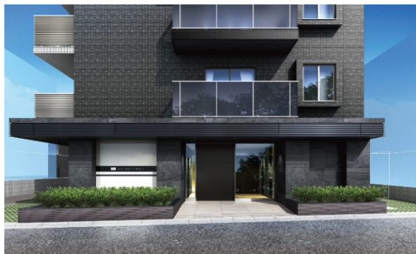
【エントランスイメージ】