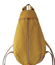
マスタードイエロー