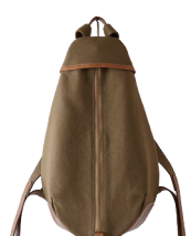
ブラウンベージュ