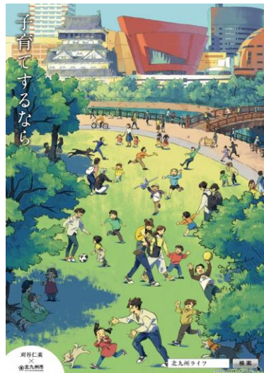
「子育てするなら」篇