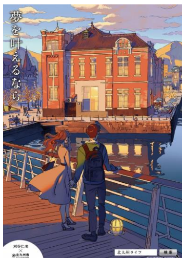
「夢を叶えるなら」篇