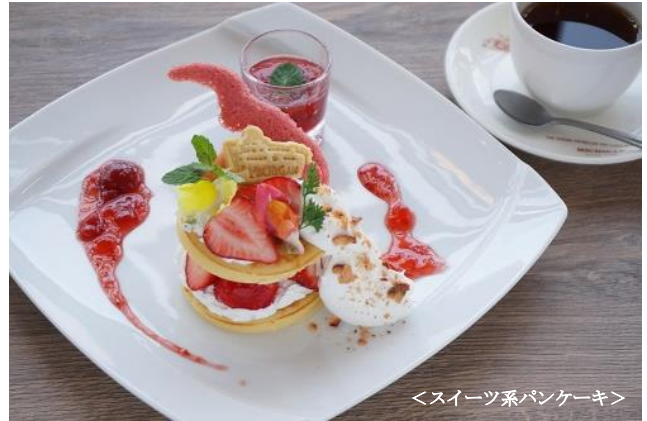
<スイーツ系パンケーキ>

パンケーキ 日野町産のいちごジャム フレッシュフルーツ（いちご） 紅茶（朝宮茶和紅茶） or コーヒー or ソフトドリンク