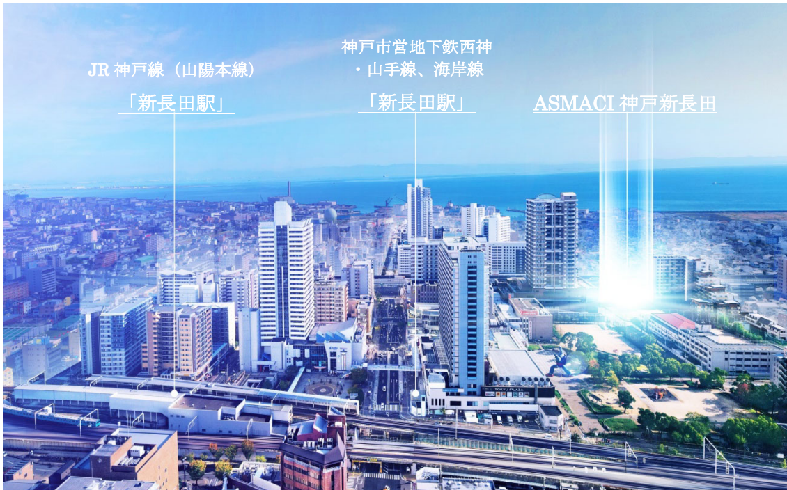
ASMACI 神戸新長田の立地イメージ