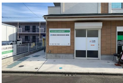
そよ風定期巡回 まちだ<外観>