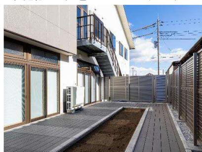
伊勢崎南ケアセンターそよ風 <家庭菜園スペース>

ショートステイ https://www.unimat-rc.co.jp/shisetsu-zaitaku/104263