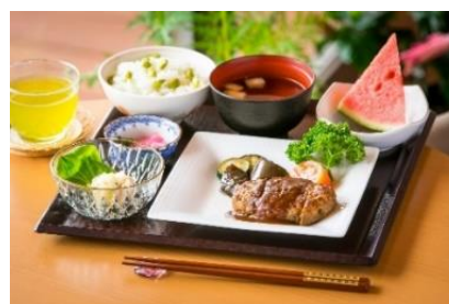
「そよ風」の食事(イメージ)

なお、元気な毎日を過ごすために欠かせない食事は「そよ風」の特徴の一つ。管理栄養士が考えた、“見て美味しそう、食べて美味しい”、栄養バランスのよいメニューを施設内の厨房で作っていますので、毎回、あたたかく美味しい食事をお楽しみいただけます。