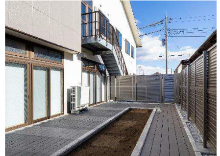
家庭菜園スペース