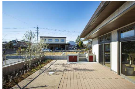
中庭・バーベキュースペース