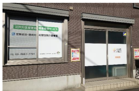
そよ風定期巡回 江戸川<外観>

そよ風定期巡回 まちだ https://www.unimat-rc.co.jp/shisetsu-zaitaku/134255