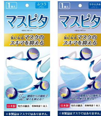
マスピタパッケージ