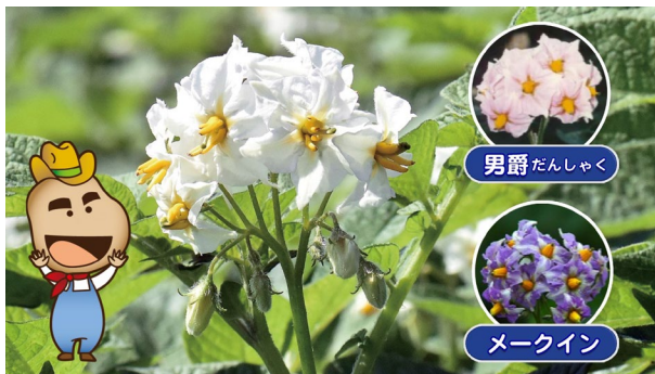
じゃがいもの花ってどんな色や形？