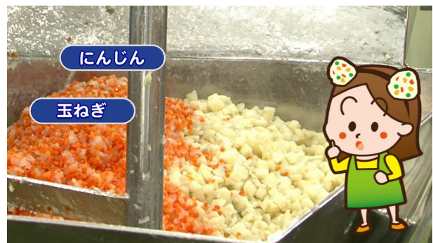
他の具材とまぜておいしいポテトサラダに