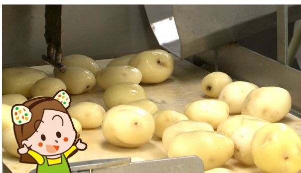
皮をむかれたじゃがいもがたくさん！