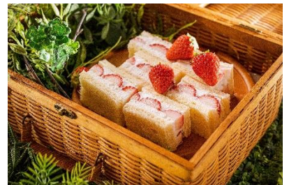
口溶けが良く、ちょっとレトロで懐かしい苺とクリームサンドイッチ