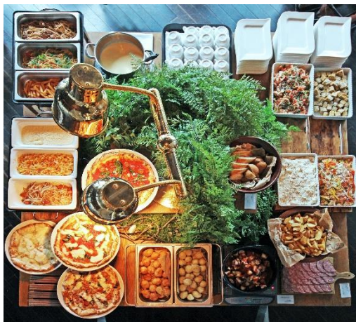
種類豊富なイタリアンの数々

XEX 日本橋のパティシエ陣が得意とする、苺が魅せる遊び心満載のスイーツと目にも鮮やかなイタリアンで、四季の始まりを感じる温かな空間をお届けします。