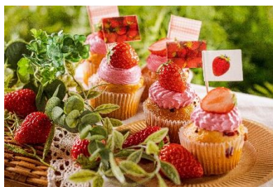
クランベリーを練り込んだ苺風味のカップケーキにクリームと苺をのせた、幸福感が凝縮された一品