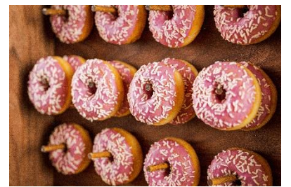
苺チョコとカラースプレーを纏わせたほんのり甘いドーナツ