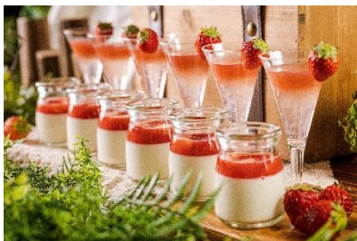
前：クリーミーな苺のパンナコッタ 後：さっぱりした甘味の苺とローズヒップのゼリー