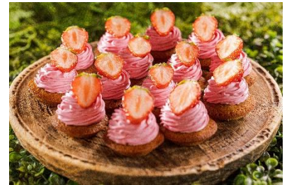
クッキー生地の上に桜と苺のクリームをのせた苺のモンブランタルト