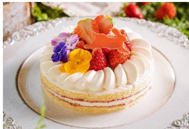
苺と言えば絶対に欠かせないショートケーキ