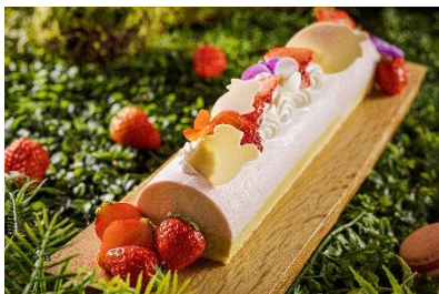
2層になった苺とピスタチオが好相性のムース