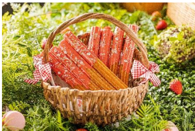
サクサクのチュロスは、チョコレートファウンテンやカラースプレーで思い思いのデコレーションを楽しんで