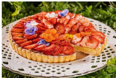
カスタードクリームの上にフレッシュ苺を敷き詰めた、贅沢なタルト