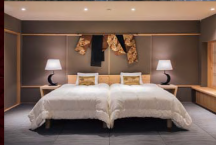
桃山雅苑 MOMOYAMA GAEN

築45年の保養所を伝統の大工の技で生まれ 変わらせたスケルトンリノベーション。 現代アートとアンティークの競演をお楽しみください。