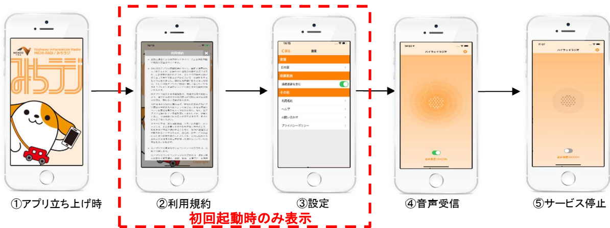
図4 アプリ起動後の画面遷移