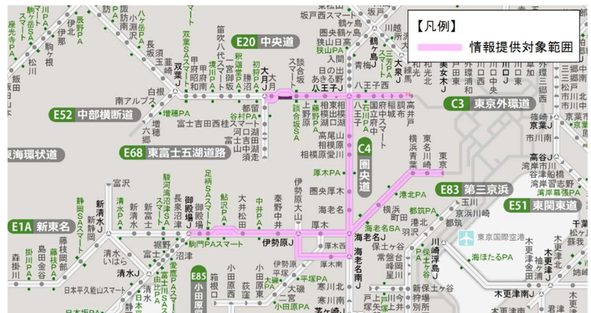
図3 情報提供対象範囲