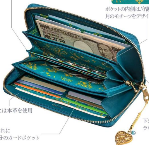
下まで大きく開く ラウンドファスナー式