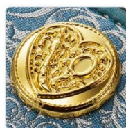
「スペース・ソード」と「ディープ・アクア・ミラー」をデザインした飾りボタン

財布の表面には、ふたりのタリスマン「スペース・ソード」と「ディープ・アクア・ミラー」をデザインした飾りボタンがあしらわれています。さらに、守護星マークとタリスマンの透かし細工とブルー・グリーン天然石アクアオーラが揺れる根付チャームが付属します。