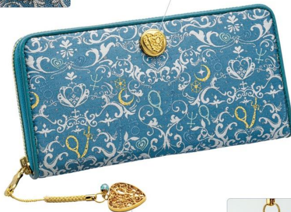
守護星マークとタリスマンの透かし細工と天然石アクアオーラが揺れる根付チャーム