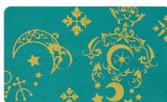
ポケットの内側は、守護星マークや月のモチーフをデザインしたオリジナル柄