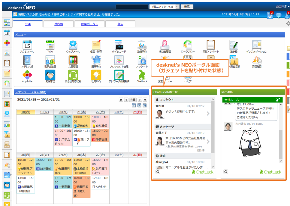
<desknet's NEO ポータルガジェット>

『ChatLuck』に届いた新着情報などを表示する「新着通知一覧ガジェット」と、『ChatLuck』のマイルーム・ルーム・コンタクトを表示する「メッセージ一覧/送信ガジェット」を追加しました。「desknet's NEO」のポータルや外部サイトに埋め込んで利用できます。