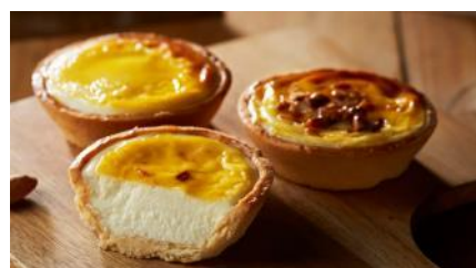
北海道産チーズを100%使用 「ちーずたると」(1個税込250円)