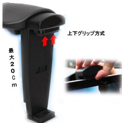
【2重スプリングでしっかりタブレット端末を固定】

ゴムグリップによってタブレットが運転中に滑らないようにし、特に上部のグリップには2重スプリングが装着されておりタブレットを安全に固定します。