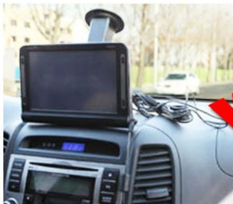
【既存の車載ホルダー】

フロントガラスではなくダッシュボードに直接取り付けられるので前方の視野角を確保でき運転中の妨害になりません。