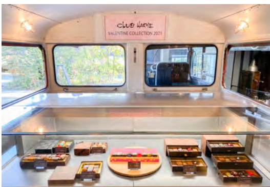
CLUB HARIE Valentine Collection 2021 in La Collina 特設サイト▼