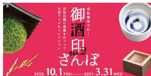
御酒印さんぽ 公式イメージ