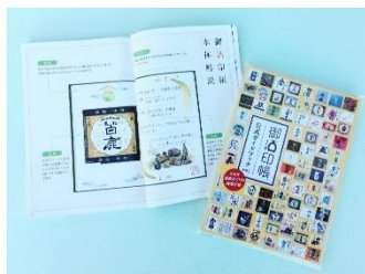
御酒印帳®公式ガイドブック vol.1