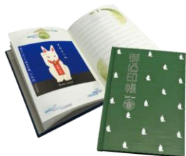
御酒印帳®にラベルコレクション