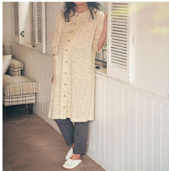
Ray Cassin niece