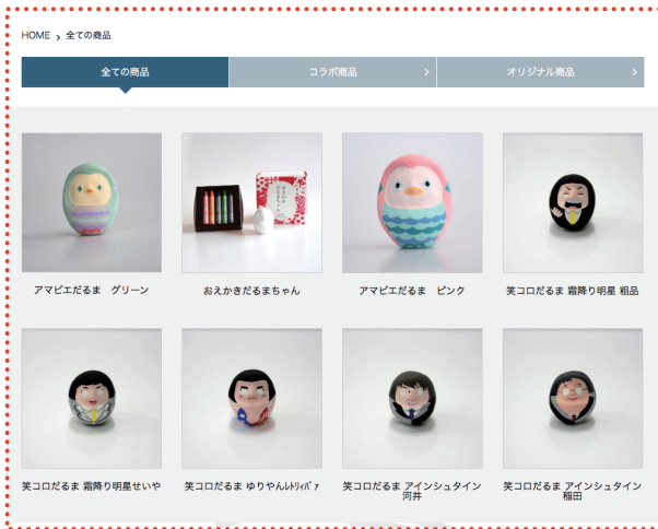
白河だるま及び地域商材のEC販売