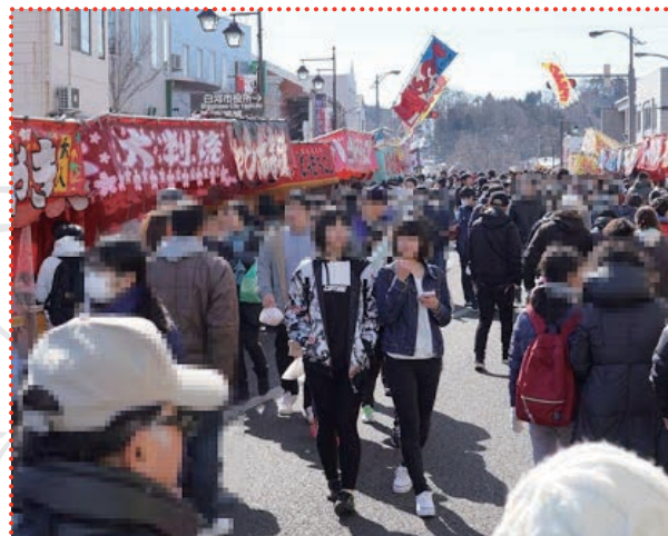
旧市内巡り (本来のだるま市会場)

チャリティー オリジナルだるまの発表会、 震災10周年グッズ オンライン限定グッズ 投げ銭 × くじ etc..