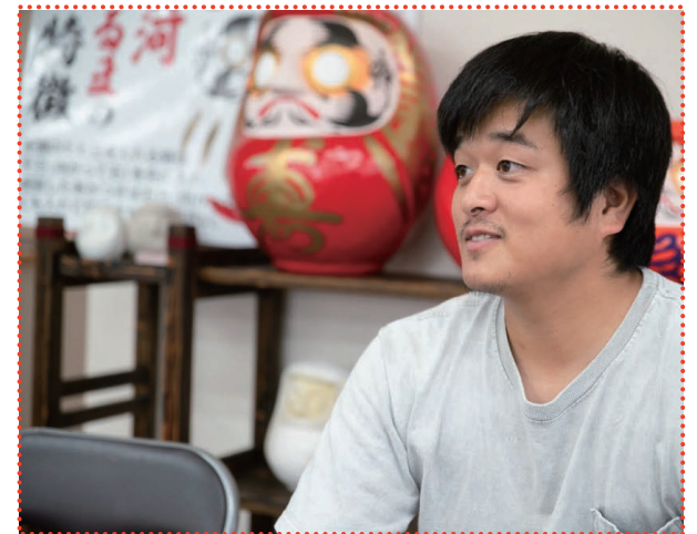
トークセッション