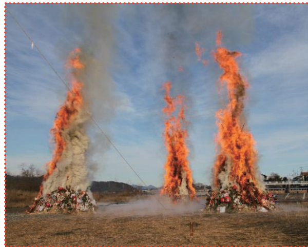
どんど焼きの中継 (全国からだるまを集める)