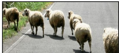
【羊さんの群れが島原活性化に大活躍♪】