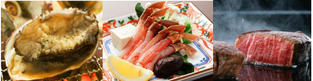
①活あわびの踊り焼き

ご夕食は、当館人気No.1！五大伝説グルメになんと！プラスメイン料理を逸品！次の3品の中からお好みで1人1品お選び下さい。皆様でそれぞれ異なるメイン料理でもOKです！