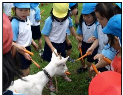
【地元の幼稚園児とのふれあい体験】