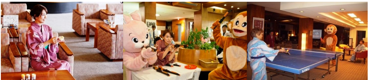
【アイス☆無料サービス (15:00~18:00)】

ホテル南風楼では、ご宿泊のお客様にお楽しみ頂けるよう館内イベントをご用意しております。