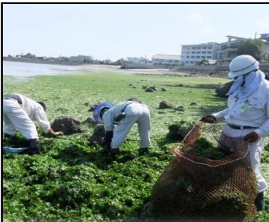
【ホテルの目の前でアオサ回収】

島原湾の海岸では、打ち上げられたアオサ(海藻)の被害が大きな問題となっています(悪臭など)。そこで、ECOプロジェクトでは、そのアオサを活用したヤギ・羊用の飼料を開発し、循環型畜産体系システムの構築に取り組んでいます。ホテル南風楼ではその飼料を使った餌付け体験を毎晩20:00頃から行っており、お客様ご自身の手で触れて頂き、ご体験頂くことができます。