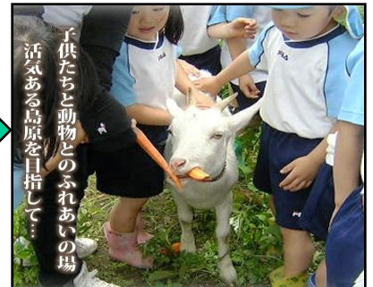
【その後、加工されて羊の飼料に】