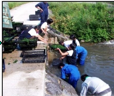
【農業高校生徒様によるアオサ洗浄】