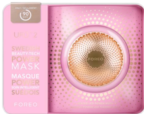
FOREO UFO2 30,000 円(税抜)