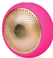
FOREO UFO2 (フクシア) ビックカメラ日本橋三越限定