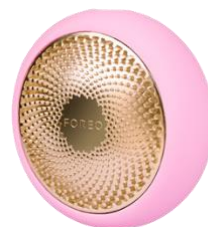
FOREO UFO2 (パールピンク) Amazon 限定