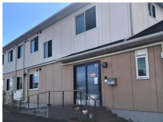
「あったかいご方木田」外観

■「あったかいごとやの グループホームそよ風」「あったかいご方木田 グループホームそよ風」の特徴 認知症ケアの知見を活かし、入居者がその人らしく、穏やかな生活を送れる環境づくりに力を入れています。認知症であっても、家庭的な環境でその能力に応じたケアを受けながら自立した生活を送り、最期までその人らしい暮らしを送れる、看取りまで行える施設です。