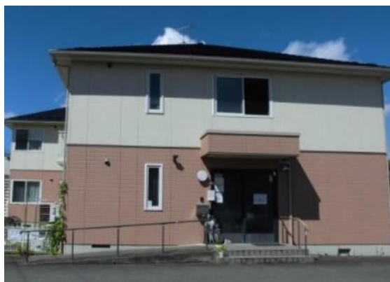
「あったかいごとやの」外観