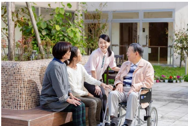
高齢者介護事業ブランド「そよ風」(イメージ)

このたびの2施設の事業譲受により、当社が運営するグループホームは113事業所となり、全国では第3位 1 です。今後も増加傾向にある認知症の高齢者がよりよく生きていくことができるような環境整備として、グループホームの展開数の増進とサービスの提供に積極的に取り組んでまいります。