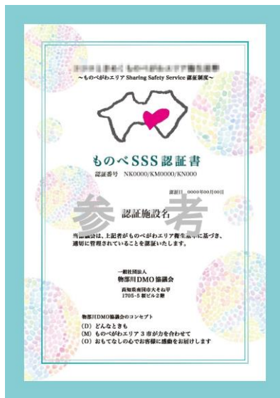
認証書※イメージ 追付与されたステッカーは重 ねて貼付していく予定