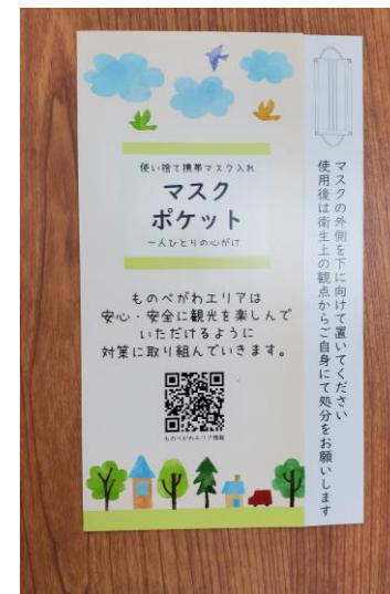
マスクポケット ※抗菌仕様