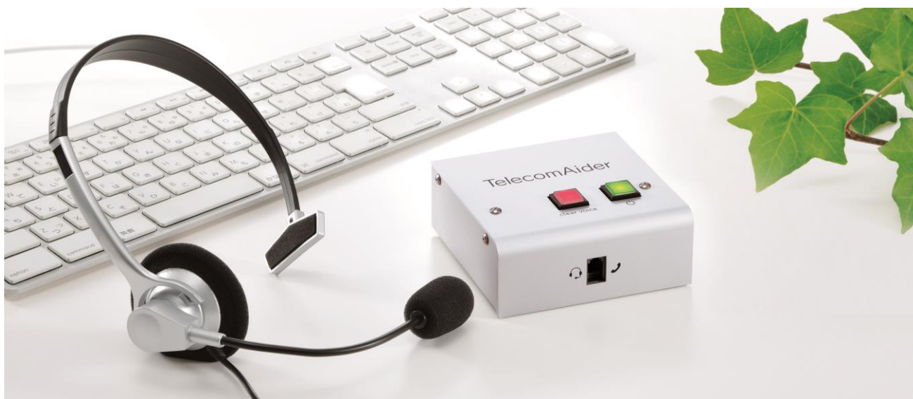
テレコムエイダー

本製品は寿通信機器株式会社の協力の下、同社の特許技術である「音声明瞭化モジュール」を搭載しており、オペレーターが使用するヘッドセット・受話器と電話機の間接続して使用します。特長としては、複雑な設定が不要なため手間なく導入することが可能であり、スイッチ一つで簡単にオペレーターの声をもっと明瞭化し、高齢者でも聞き取りやすい音声にすることができます。