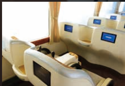
各シートには個別モニター(マルチ4チャンネルシステム)が設置されテレビやDVDなどいろいろな映像コンテンツをお楽しみいただけます。