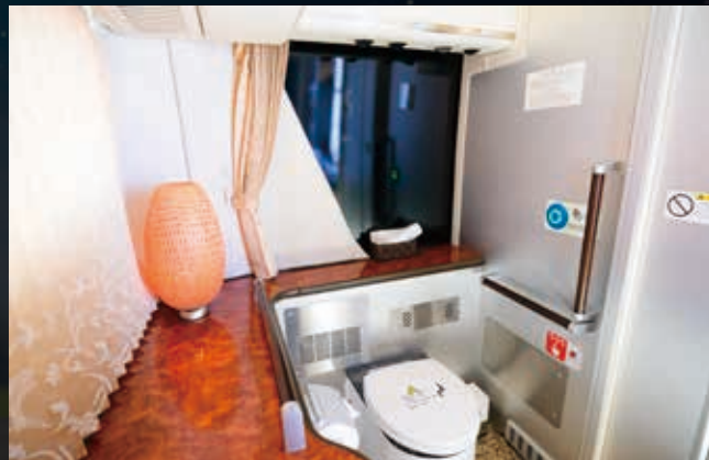
長距離移動も安心な化粧室を完備 広いパウダールーム調の化粧室をバスの後部に設置いたしました。長時間の移動や渋滞の際にも安心です。