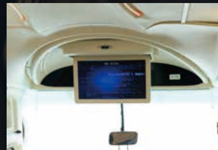
車載前方高所にはGOPROを設置し、バス前方のモニターをはじめ、各座席の個別モニターでもダイナミックな風景をお楽しみいただけます。