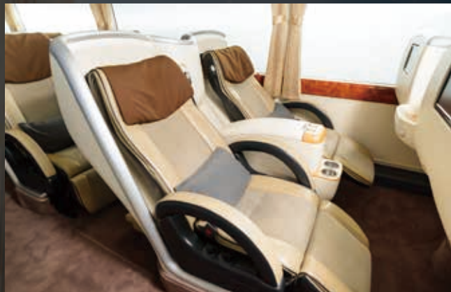
独立シートで気兼ねなくシートをリクライニング 最大136度まで倒せるリクライニングシート。後部座席に影響のない「客席仕切りパーテーション」形式