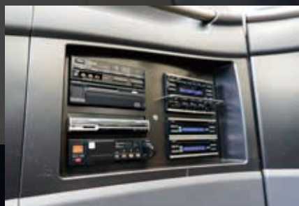
個別のパーソナルモニター視聴のほか、バス全体で視聴できるDVD、CD、地上デジタル放送等を完備しています。バス中でのプレゼンテーションなどにもご利用ください。