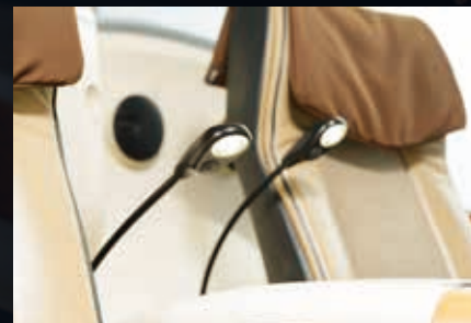
各座席には目にやさしいLEDライトの読書灯をご用意いたしました。夜間まわりの方にも気兼ねせずご使用いただけます。