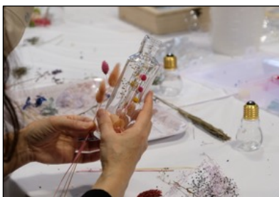
体験教室の様子・1

子供から大人まで、ハンドメイドをしたことがない方でも気軽に参加できる体験教室「マルシェのがっこう」を開催。ものづくり市民が先生となって、アクセサリやフラワーアレンジ、クラフト、おもちゃまで、 世界にひとつ・自分だけのハンドメイド作品づくり を体験できます。