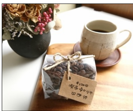
自家焙煎のコーヒー豆 by 本と珈琲 喫茶ゆかりや