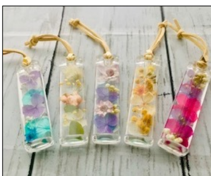
ハーバリウムの雑貨作り by 布村 由美子