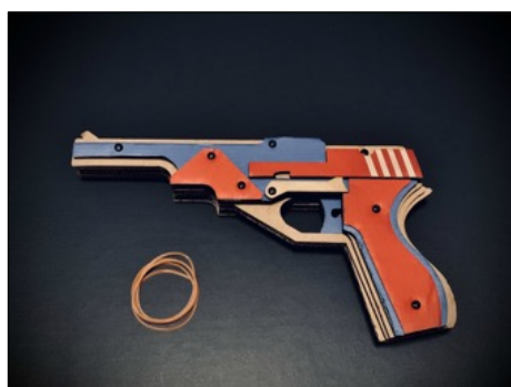
段ボールゴム鉄砲作り by 小寺誠