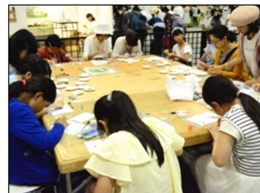
体験教室の様子・2