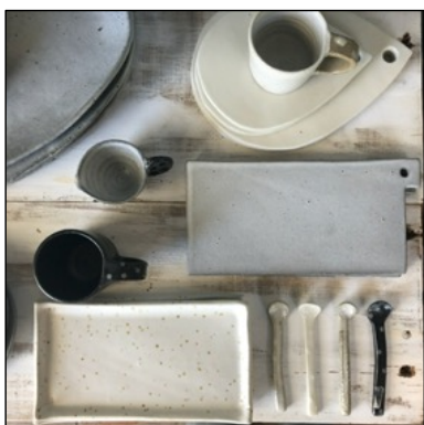
うつわや雑貨の陶磁器 by ととうや