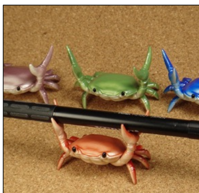
カニペンホルダー by アーニトル