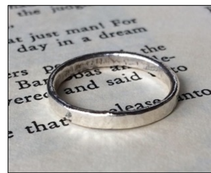
銀のつちめ模様リング作り by 佐藤装身具