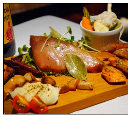
徳島産魚介のスモーク by 日和佐燻製工房