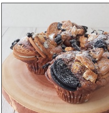
こだわり素材のマフィン by みんなのマフィン