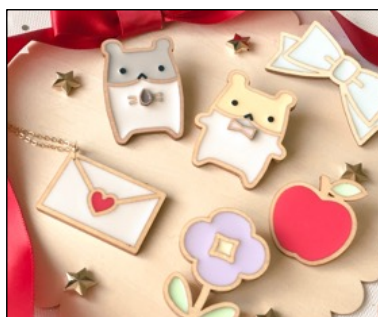
木とレジンアクセサリ by リンゴノアメ

全国各地から集まるものづくり市民による、アクセサリやインテリア・雑貨、靴・カバン、伝統工芸、ファッションなど、プロの作品と比べても遜色ない 個性的・高品質な10,000点以上の手づくり作品 が会場を埋め尽くします。また、ケーキやクッキー、パン、はちみつ、紅茶など、こだわりの手作りフードも出店されます。