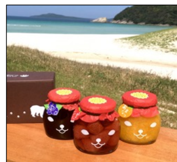
無添加ジャム by くまごろう