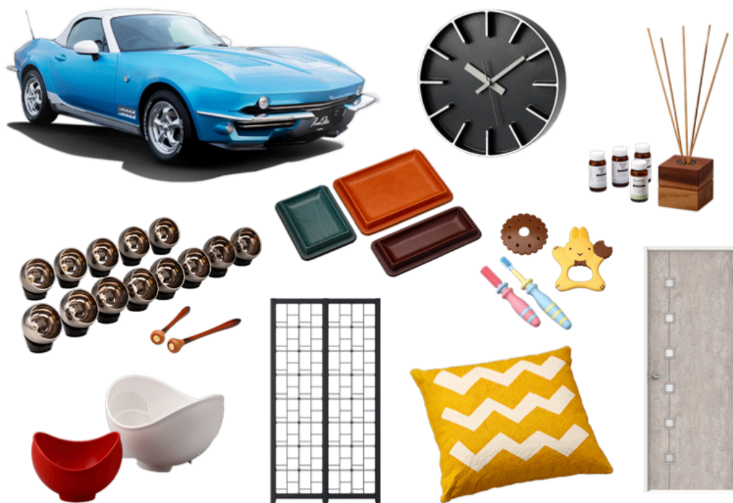
今年度新たに選定された「富山プロダクツ選定商品」の一部

デザインの活用でビジネスの活性化を図り、県内企業のバックアップを目指す富山県総合デザインセンターは、毎年、富山県内で企画、製造される性能、品質及びデザイン性に優れた工業製品を「富山プロダクツ選定商品」として選定しています。2002年から始まったこの事業では、これまで335点を選んできましたが、2020年度は16社23点を追加しました。富山県内で展示を行うとともに、最新版リーフレットを全国で配布します。