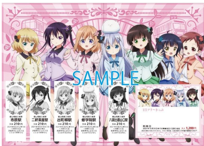
コラボきっぷのイメージ