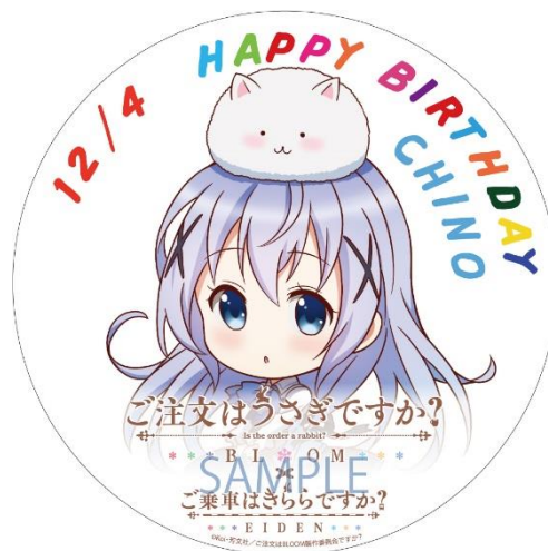
誕生日ヘッドマークのイメージ