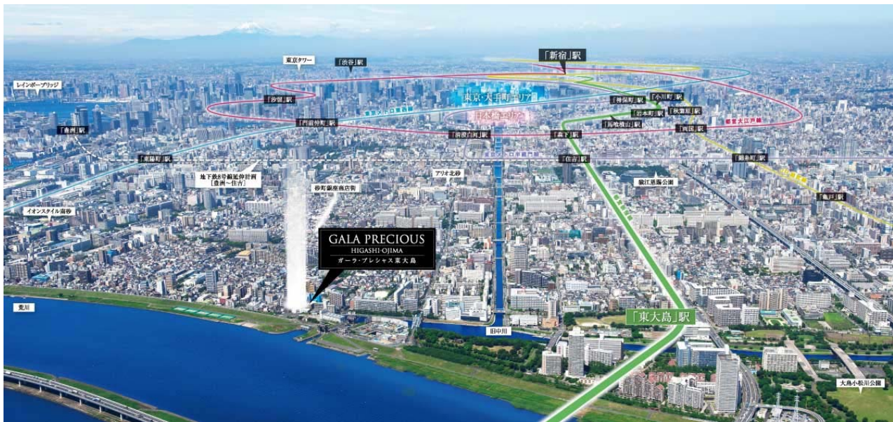
【現地上空からの航空写真】