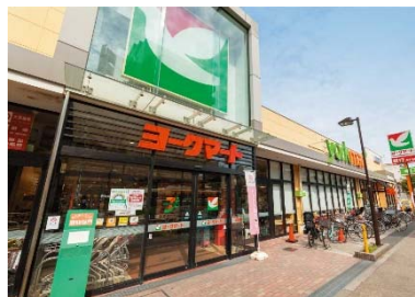
【ヨークマート東砂店】