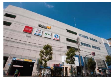
【ダイエー東大島店】