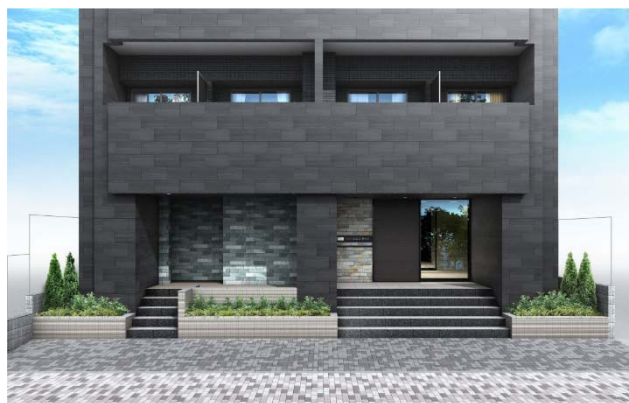
【エントランスイメージ】