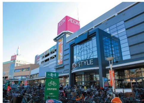
【イオンスタイル南砂】