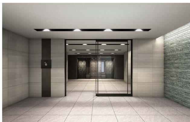
【エントランスホールイメージ】