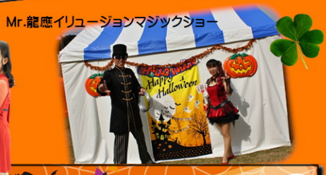
Mr.龍應イリュージョンマジックショー