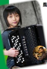
風太 & PAPA