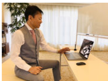
実際のオンライン施術風景(2)