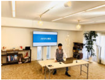
実際のオンライン施術風景(4)