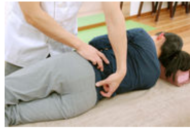
分かりにくい場合はモデルを活用