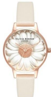
OLIVIA BURTON 3D Daisy OB16FS101 ¥20,000