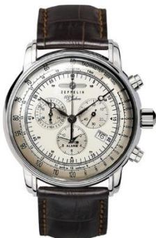
ZEPPELIN SPECIAL EDITION 100 YEARS 7680-1N ¥55,000