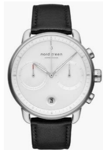
Nordgreen Pioneer PI42SILEBLXX ¥29,000