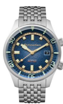
SPINNAKER BRADNER SP5062-22 ¥42,000