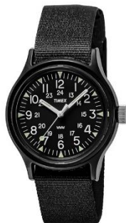
TIMEX Original Camper TW2R13800 ¥8,300

ストレスがたまりがちな生活の中では、身につけるものの肌触りなどについていつも以上に敏感になりがちなものです。そんな時期でも、無理なくつけられる腕時計がこれからは手に取られる機会が増えるでしょう。つけていることを感じさせないような軽い時計やフィット感に優れた時計など、着用感が良い腕時計を選出する部門です。