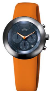
IKEPOD Chronopod IPC014SILO ¥92,000