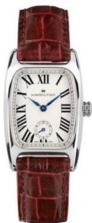
HAMILTON BOULTON SMALL SECOND H13321811 ¥64,000

めまぐるしく変わっていく世の中だからこそ、変わらないものは気持ちを落ち着かせてくれます。昔から愛されてきたクラシックな腕時計が、「周りに流されずにいることの大事さ」を語りかけてくる……。そんなタイムレスな魅力を放つ時計を選出する部門です。