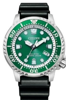
CITIZEN PROMASTER MARINE BN0156-13W ¥37,000