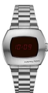
HAMILTON PSR H52414130 ¥90,000