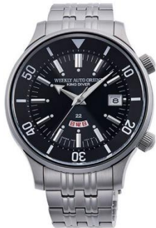
ORIENT KING DIVER RN-AA0D11B ¥45,000