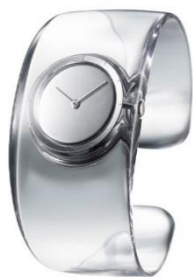
ISSEY MIYAKE O-オー SILAW001 ¥18,000

人に会う機会が減った人も多い2020年、人に見せるための腕時計ではなく自分の気分を癒やしてくれるような腕時計が欲しくなっている人も多いのでは？見る度にリラックスできるような腕時計を身につけたい。そんな人にお薦めのアートのような腕時計を選出する部門です。