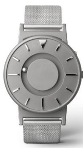
EONE BRADLEY MESH SILVER BR-C-MESH ¥37,500