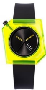
KLASSE14 K14 IRREGULARY SQUARE WKF19YW001M ¥14,000