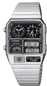
CITIZEN ANA-DIGI TEMP JG2101-78E ¥24,000