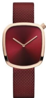
BERING Pebble Watch 18034-363 ¥23,000