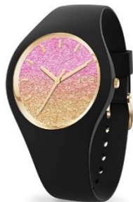
ICEWATCH ICE-Lo ICE-16905 ¥14,000