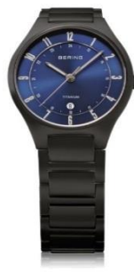
BERING Link Titanium 11739-727 ¥31,000