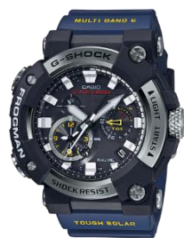
G-SHOCK FROGMAN GW-F-A1000-1A2JF ¥90,000

身につけるものには自分の気持ちを変えてくれる効果があります。日に何度も視線を落とす腕時計であれば、なおのこと気持ちへの影響は大！この部門では、見るだけで思わず元気になりそうな時計を選出します。