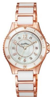
Angel Heart Love Sports WLS29PG ¥23,000