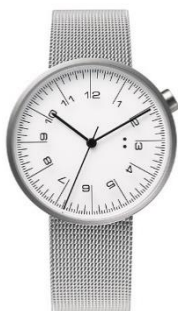
10:10 draftsman draftsman001/S001 ¥18,500