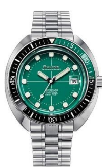
BLOVA Mechanical Archive Devil Diver 96B322 ¥84,000