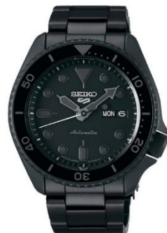
SEIKO 5SPORTS Street Style SBSA075 ¥39,000