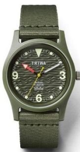
TRIWA Time for Ocean TFO101-CL150912 ¥15,000