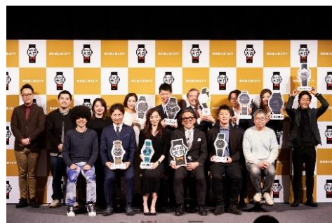
■第1回時計屋大賞の様子

■後援：株式会社ヌーヴ・エイ / シチズンリテイルプランニング株式会社 / 株式会社ピーナッツファーム