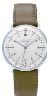
JUNGMANS MAXBILL HANDAUFZUG JH-027.3701.00 ¥110,000