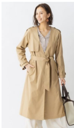
トレンチ風 ノーカラーコート ¥12,994 (税抜) ¥6,497 (税抜)

アパレル、シューズ、バッグ、小物、インナーなどのファッションアイテムを中心に全品半額セールを行います。