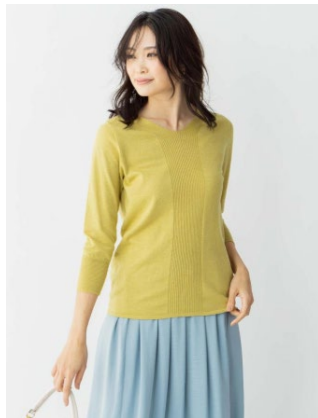
デザインVネックニット フルオーバー ¥5,996 (税抜) ¥2,998 (税抜)