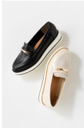
ビット付 厚底スニーカー ¥5,996 (税抜) ¥2,998 (税抜)