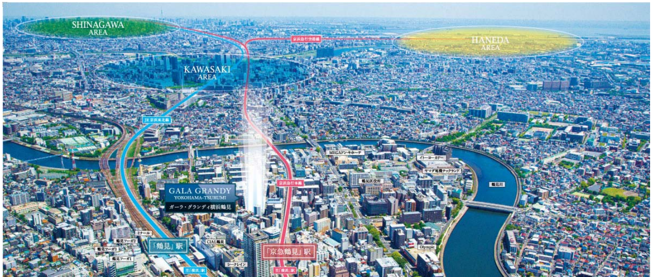
【現地上空からの航空写真】