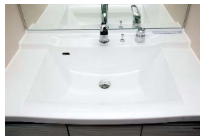
【ボウル一体型洗面化粧台】