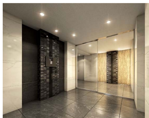
【エントランスホールイメージ】