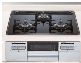
【Siセンサー付き3口ガスコンロ】