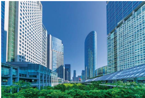
【品川インターシティ・品川グランドcommons】