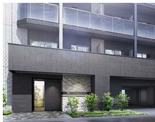
【エントランスイメージ】