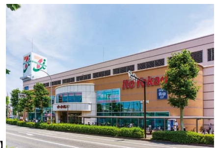
【イトーヨーカドー】