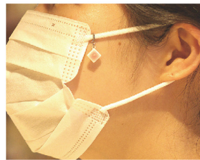
上紐に着ければ、可愛く頬を飾ります。