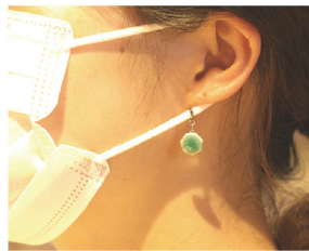
下紐に着けてピアスのように。