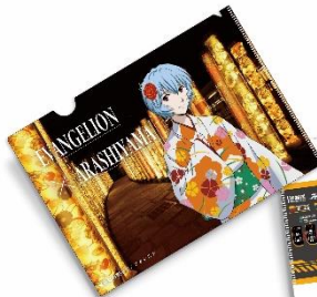
嵐電オリジナルクリアファイル 全1種 税込440円