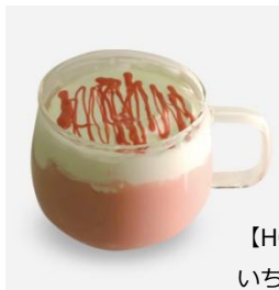
【HOT】 マリのホイップ いちごラテ 税込600円