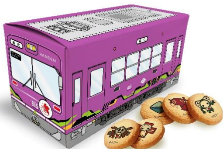
コラボラッピング（初号機ver.） 電車箱入りクッキー 全1種 税込1,400円