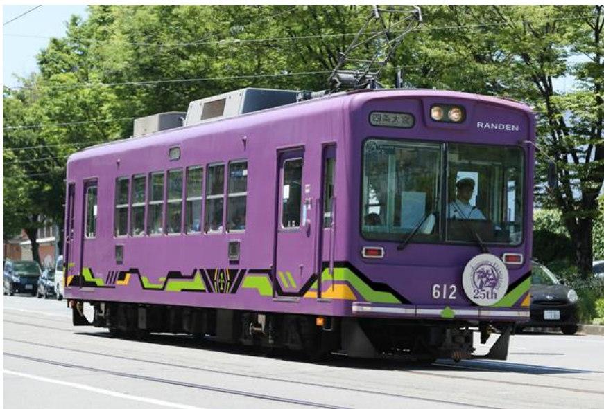
ラッピング電車イメージ