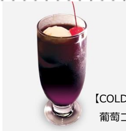
【COLD】 シンジの 葡萄コーラ 税込600円