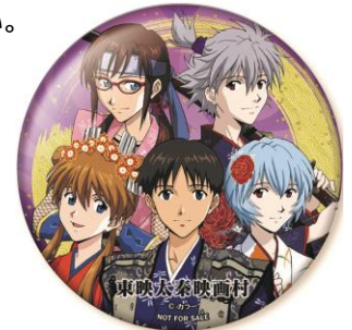
特製缶バッジイメージ