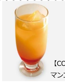
【COLD】 アスカのパッション マンゴージュース 税込600円