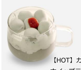
【HOT】 カヲルの黒ゴマ ホイップラテ 税込600円