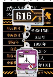
つながるアクリルチャーム （615号車、616号車） 全2種 税込650円