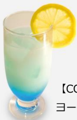
【COLD】 レイのカルピス ヨーグルト 税込600円