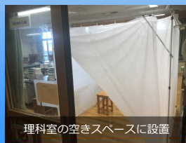
『エアトール+』は商標及び実用新案登録出願中です。

体育館など広いスペースでご活用いただくことは当然ながら、教室などでもスペースを最大限有効活用いただけます。活用事例は、一般的な教室8m×8mの広さで合計6スペース、1スペース当たり4名程度を想定したモデルになります。高さ150cm×幅180cm×奥行180cmのL字型を4セット、高さ150cm×幅180cm×奥行180cmの4面型を2セットを組み合わせ参考資料の配置図になります。組み合わせ次第で様々なバリエーションに対応できます。また、隔離などの対応が必要になった場合は、そのスペースに合わせて組み合わせるアルミパイプの本数を増減させることでご対応いただけます。不測の事態にも臨機応変に対応できることが「エアトール+」の特長です。