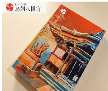
御朱印帳イメージ：KOGAKEN