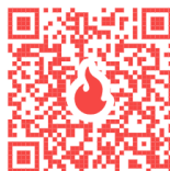
クラウドファンディング アクセス用QRコード