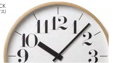
RIKI CLOCK (タカタレムノス)