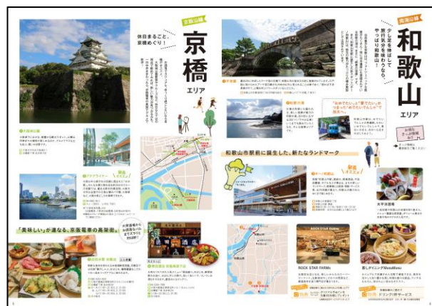
パンフレット「京阪・南海沿線 日帰リエえとこめぐり」