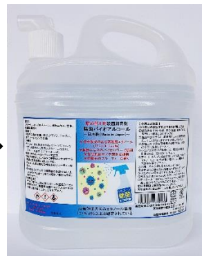
詰め替え用コックに取り替え